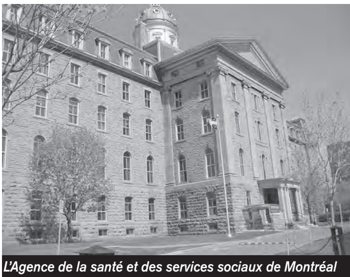
L'Agence de la santé et des services sociaux de Montréal

Depuis que le CRADI a déposé son Avis, une réunion du comité aviseur de l'Agence a eu lieu, au cours de laquelle on nous a rappelé que la situation de crise économique actuelle pouvait avoir une incidence sur le développement de services. Lors de crises précédentes, au début des années 80, on se souvient des coupures de salaires des employés de l'État, et dans les années 90, des compressions budgétaires qui ont entraîné la transformation de l'offre de services (ex. : secteur résidentiel). Ainsi, fallait-il attendre la sortie du budget au printemps avant de prendre des décisions en rapport avec le plan d'action. Maintenant que le budget est connu, il faut attendre, cette fois, de connaître comment les montants seront répartis entre les régions, ce qu'on devrait savoir en juin ou au plus tard en septembre.